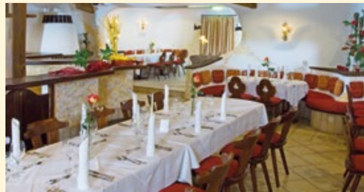
Gestaltung: fotografie - Dischingen / www.fotografie.de